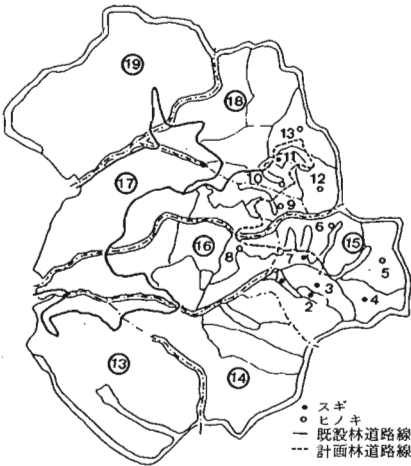
図-1 調査対象地域図