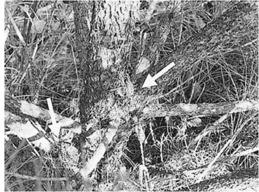
b: マツノマダラカミキリ幼虫によるフラス (矢印)