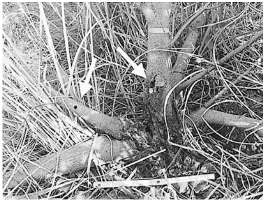
c: ゴマダラカミキリによる幹の被害 (矢印は脱出孔)