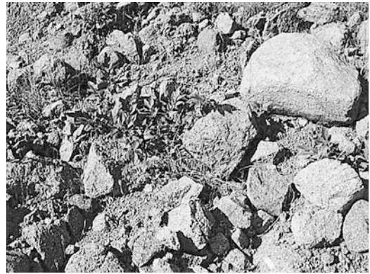
d: オオバヤシャブシの実生