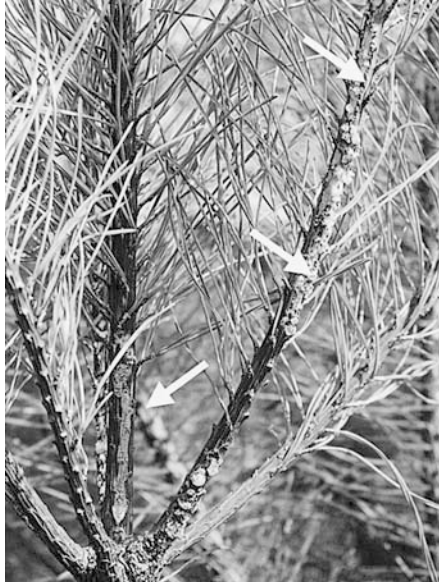
a: マツノマダラカミキリの後食痕 (矢印)